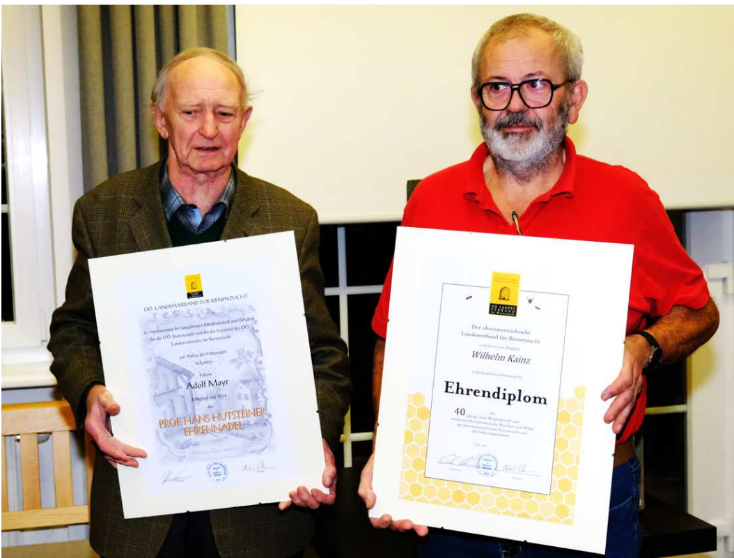
Im Bild: Adolf Mayr, Wilhelm Kainz